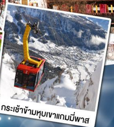
กระเช้าข้ามหุบเขาเกมมีพาส

18-24 ก.พ. 68 11-17 มี.ค. 68 29 เม.ย. - 05 พ.ค. 68